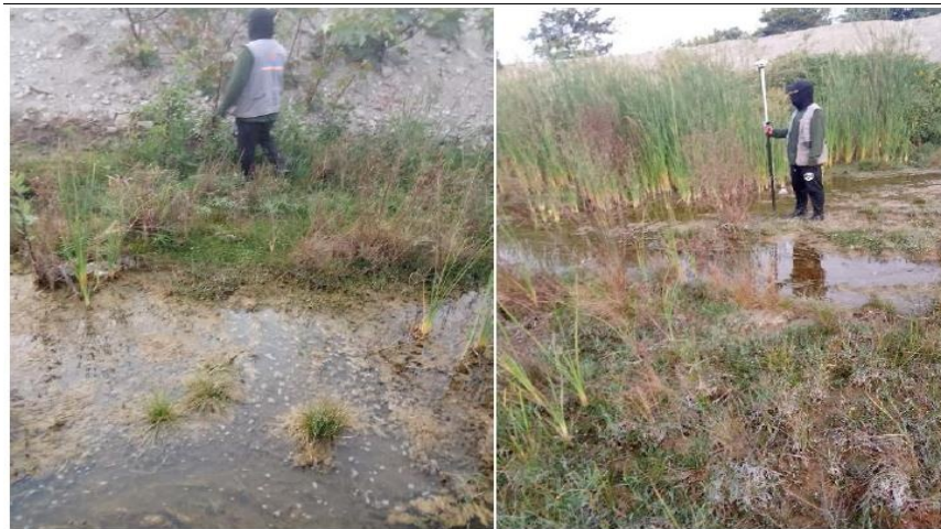
FIGURA N° 01: TRAMO CRÍTICO DEL RÍO HUAMANZAÑA EN EL SECTOR SAN CARLOS BAJO. SE INICIARON LOS TRABAJOS DE LEVANTAMIENTO TOPOGRÁFICO UTILIZANDO UN EQUIPO DE GPS DIFERENCIAL, TOMANDO COMO PUNTO DE REFERENCIA UN BM, TAL COMO SE OBSERVA EN LA IMAGEN. SE PUEDE APROCIAR EL ESTADO ACTUAL DEL TRAMO EN ESTUDIO, LO QUE EVIDENCIA LA CONTINUIDAD DE LOS TRABAJOS REALIZADOS PREVIAMENTE. SE VISUALIZA LA PRESENCIA VEGETACIÓN DENSE EN LA CAJA DEL TRAMO EN ESTUDIO.