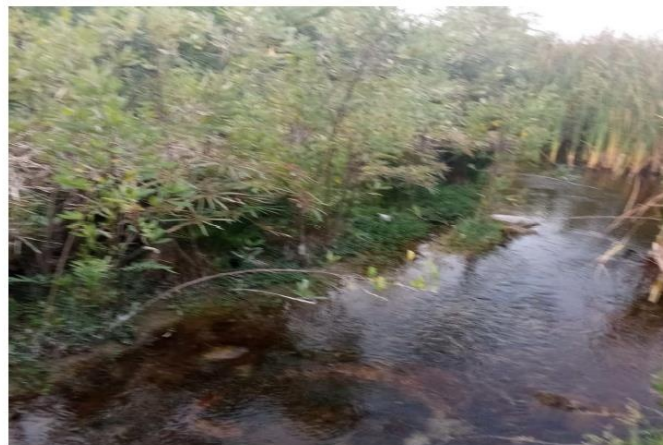
FIGURA N° 02: MATERIAL SEDIMENTADO EN EL TRAMO ANALIZADO, CONFIRMANDO LA COLMATACIÓN EN EL SECTOR SAN CARLOS BAJO. SE REALIZÓ UN LEVANTAMIENTO TOPOGRÁFICO UTILIZANDO GPS DIFERENCIAL, TOMANDO PUNTOS A LO LARGO DE TODA LA SECCIÓN DEL CANAL. LA INFORMACIÓN OBTENIDA FUE CORROBORADA CON LOS USUARIOS DE LA ZONA. COMO SE PUEDE OBSERVAR EN LA IMAGEN, ALGUNOS TRAMOS PRESENTABAN AGUA Y UNA DENSIDAD SIGNIFICATIVA DE MALEZA.